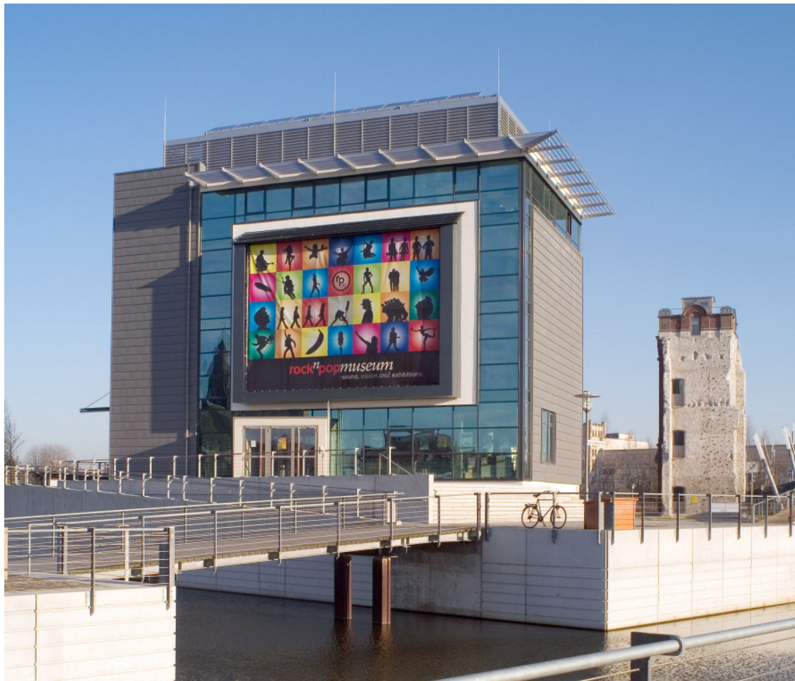
Das rock`n`popmuseum in Gronau